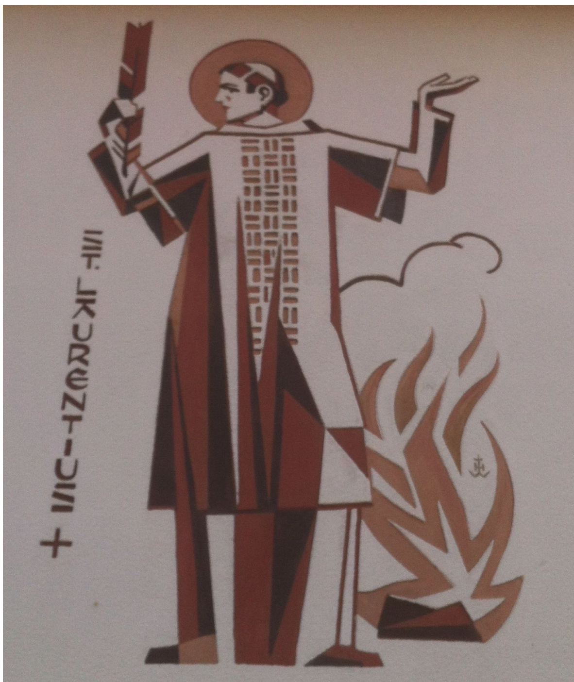
Heiliger Laurentius an einer Hauswand im Zinkbergweg in Mackenzell Gedenktag 10. August